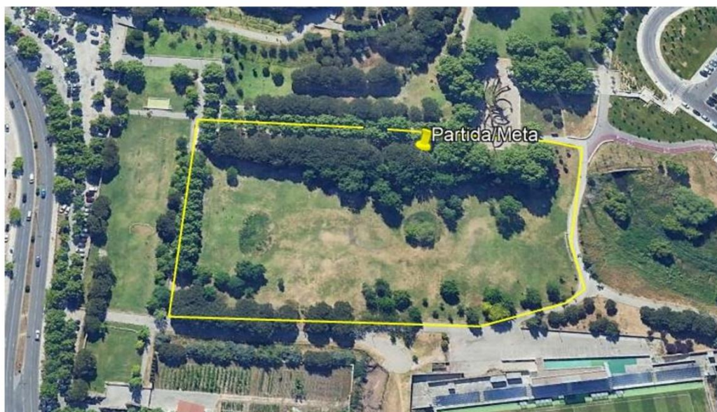
Circuito circular no Parque da Paz