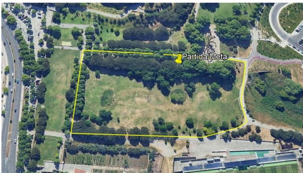
Circuito circular no Parque da Paz